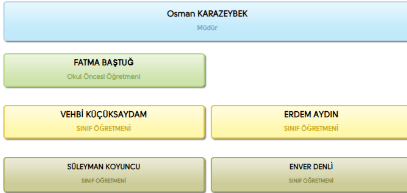
Şekil 1: Organizasyon Şeması